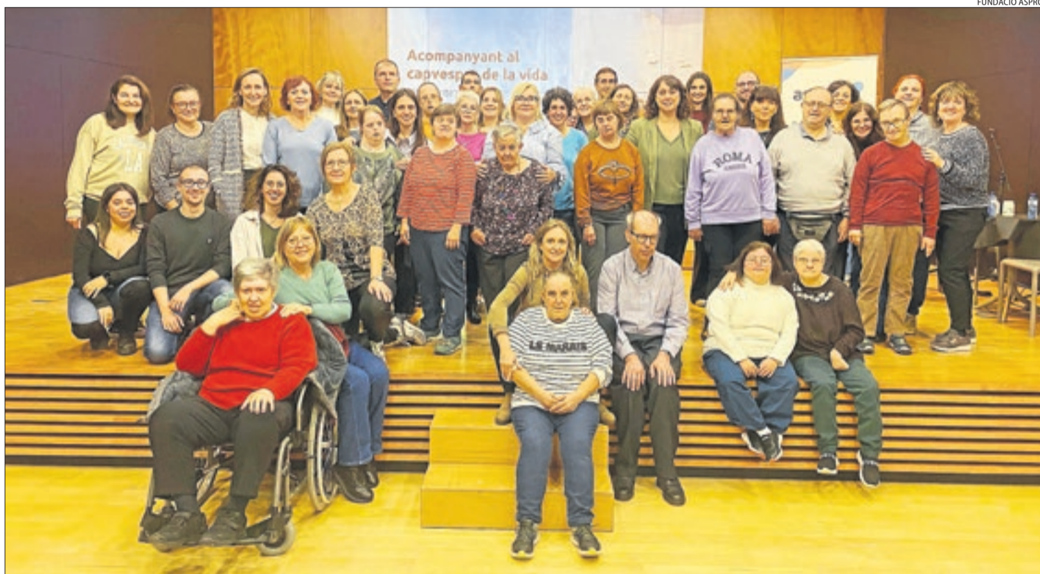
Foto de família dels usuaris i treballadors de la Fundació Aspros que ahir van participar en la jornada a l'Espai Orfeo de Lleida.

Donar resposta a les necessitats i millorar l'acompanyament durant el procés de vellesa