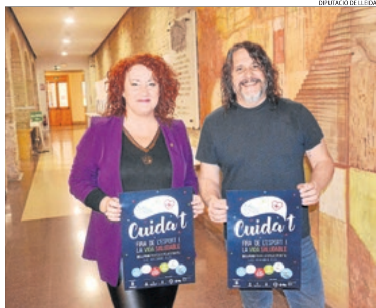
La diputada Sandra Marco i l'alcalde de Bellpuig, Jordi Estiarte.

dencials i un dels centres ocupacionals posant el focus en les necessitats i la millora de la qualitat de vida. Anys més tard, després de la pandèmia de la covid, l'entitat va adaptar serveis i infraestructures a les necessitats d'aquests usuaris sèniors.