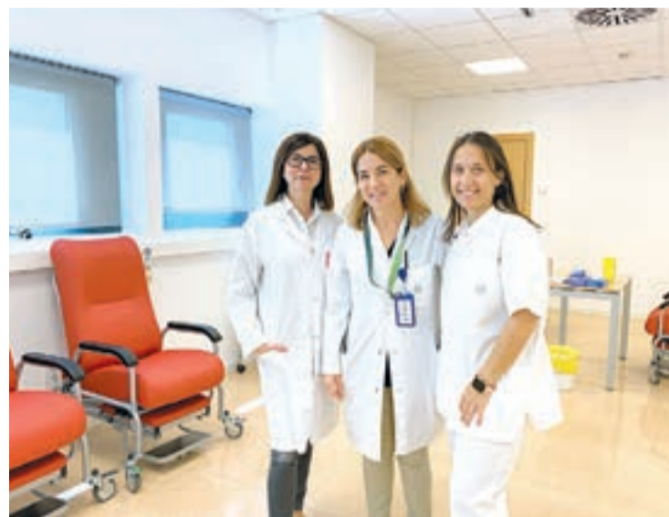
Alguns dels professionals que tenen cura del Servei d'Al·lèrgia de l'Hospital de Santa Maria

L'asma és una patologia que presenta una elevada