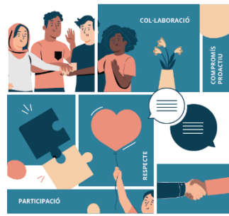
Codi ètic Versió en lectura fàcil