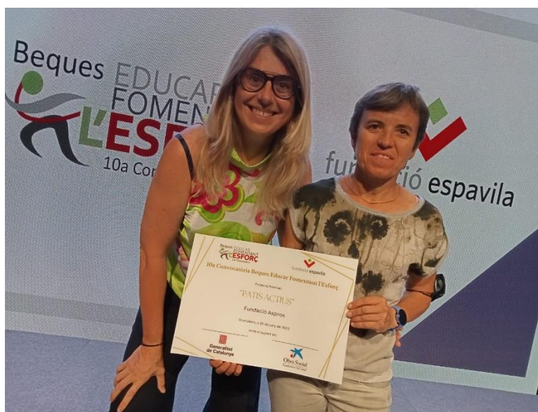
La Fundació Aspros rep el Premi de Foment a l'esforç de la Fundació Espavila , pel seu projecte Patis Actius.