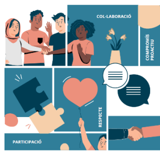
Codi ètic Versió reduïda