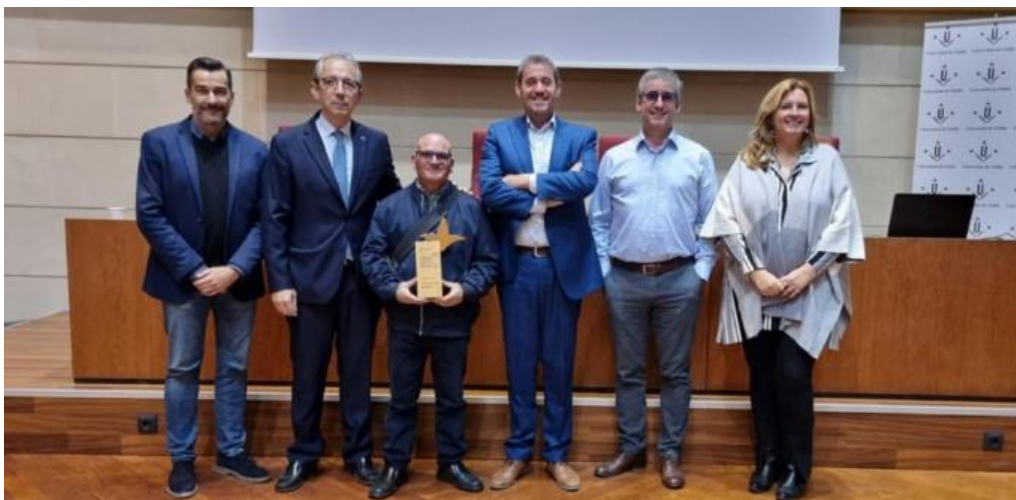
Premis del Consell Social de la Universitat de Lleida 2022. Reconeixement al lideratge social.