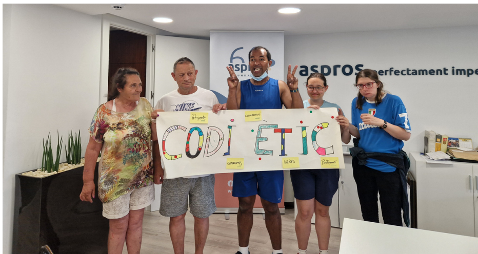
Persones autogestores de les Llars Urbanes