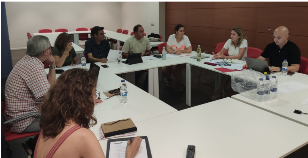
Espai de Reflexió Ètica (ERESS)