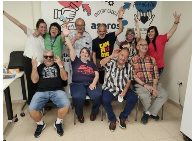
Persones residents de Casa Nostra (Sudanel·l)