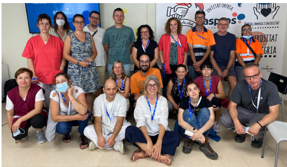
Professionals de la Fundació Aspros