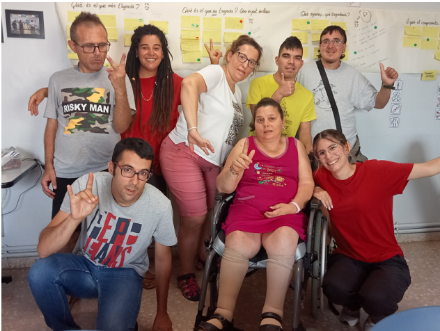
Persones residents de La Coma (Sidamon)