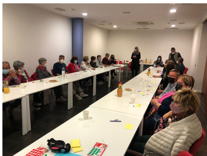
Famílies de persones ateses