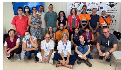
Professionals de la Fundació Aspros