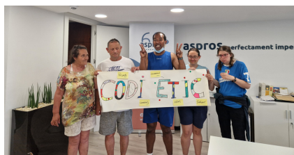
Persones autogestores de les Llars Urbanes