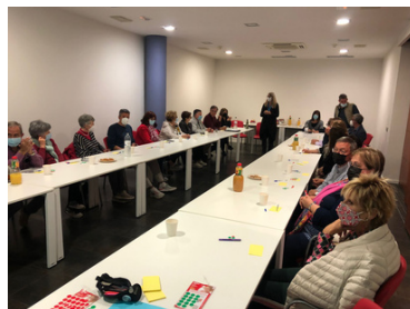
Famílies de persones ateses