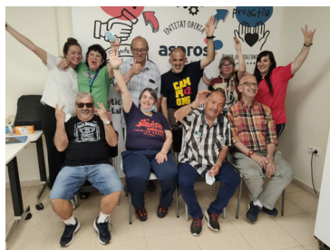
Persones residents de Casa Nostra (Sudanel)