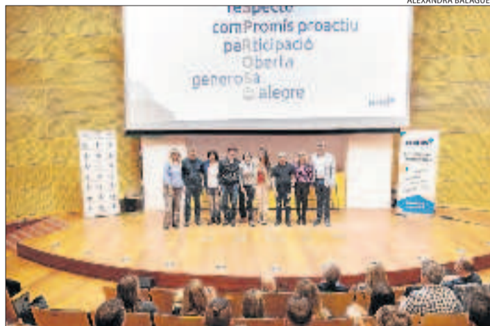
Aspros va exposar el seu full de ruta per a aquest 2020 a la UdL.