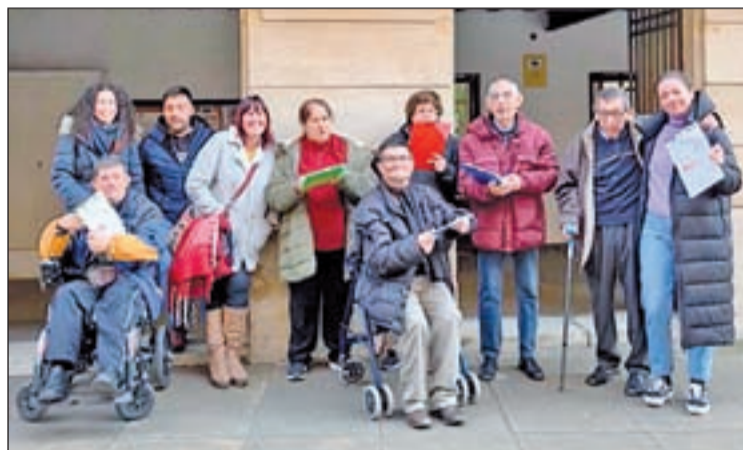
Imatge del grup 'Validem' al consistori de les Borges

Mitjançant aquest acord, el grup 'Validem' de la Fundació Aspros avaluarà els espais públics de la capital de les Garrigues per analitzar la seva accessibilitat. Posteriorment, es farà una proposta d'adaptació i la validació d'aquests espais, per tal de corroborar que es converteixen en espais accessibles cognitivament per a totes les persones. D'entre