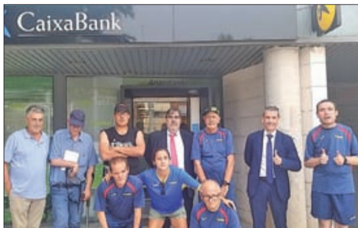
El proyecto nació en 2017 y este año se ha reanudado

La Fundació “la Caixa”, a través de su oficina de CaixaBank en Al-