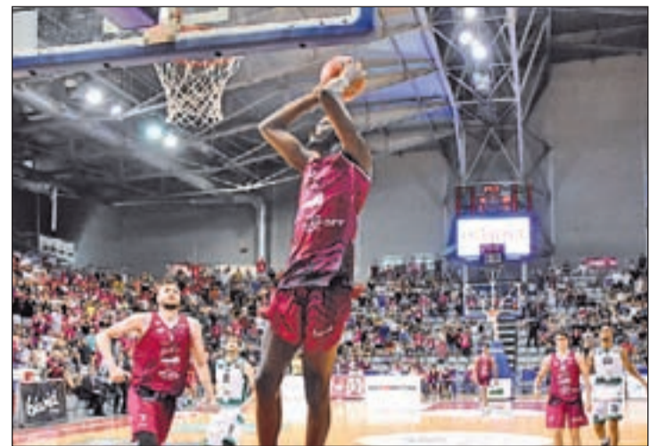
El pivot tiene difícil seguir en el Força Lleida